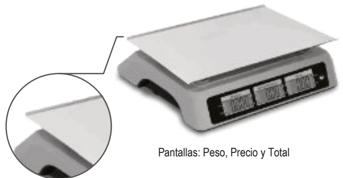
Pantallas: Peso, Precio y Total