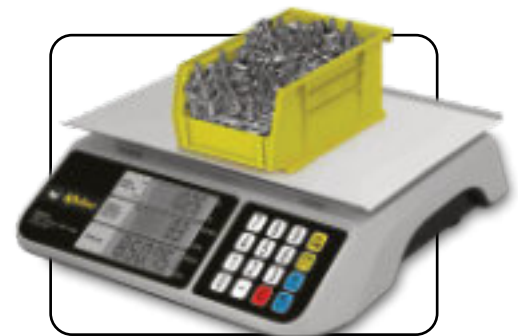
Función de conteo de piezas